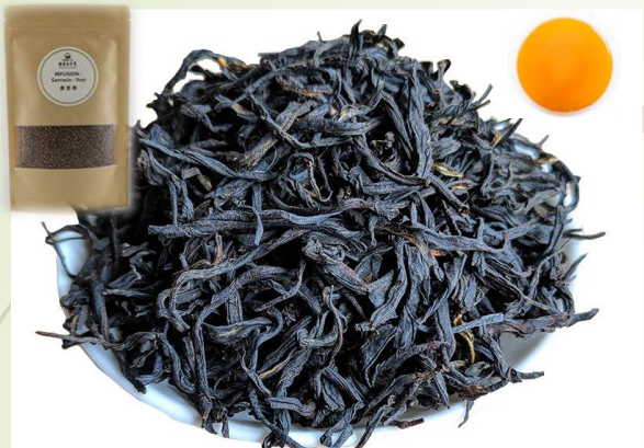
Thé rouge – Impérial 10 €t/c/50g