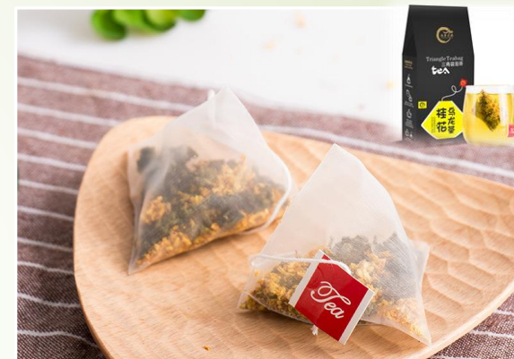
Oolong à l'Osmanthus 9.90 €ttc/boîte