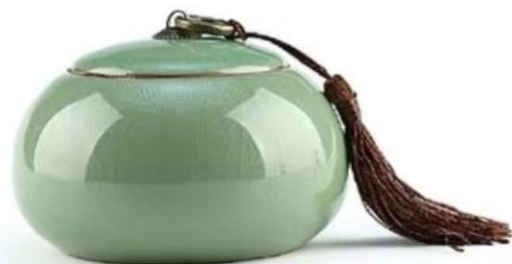
P1 Vert craquelé fin