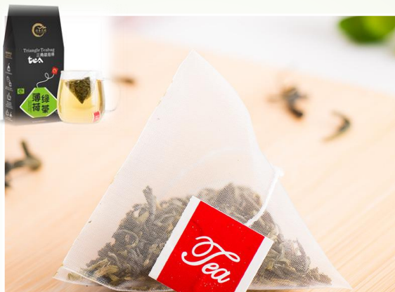
Thé vert à la menthe 9.90 €ttc/boîte