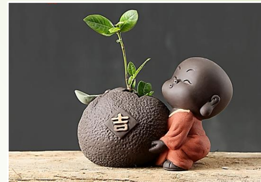
Moine de Shaolin S1 : 24.90 €Ttc