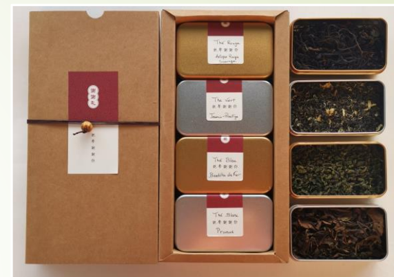
Assortiments de 4 thés 39.90 €t/c