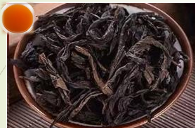
Oolong des moines 12 €t/c/50g

Notes de noisettes torréfiées et caramélisées.