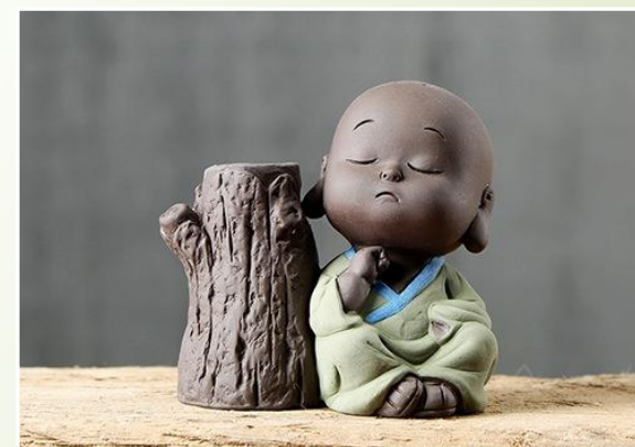
Moine de Shaolin S2 : 24.90 €Ttc