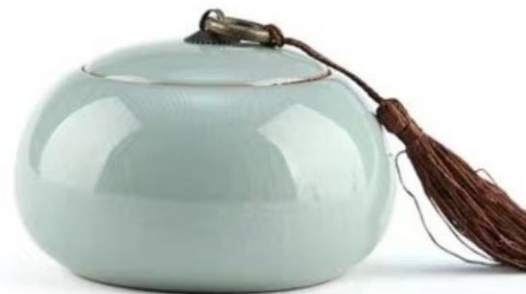
P4 Gris craquelé fin