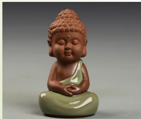
Bouddha Q2 : 19.90 €Ttc