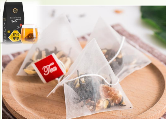
Thé rouge au citron 9.90 €ttc/boîte