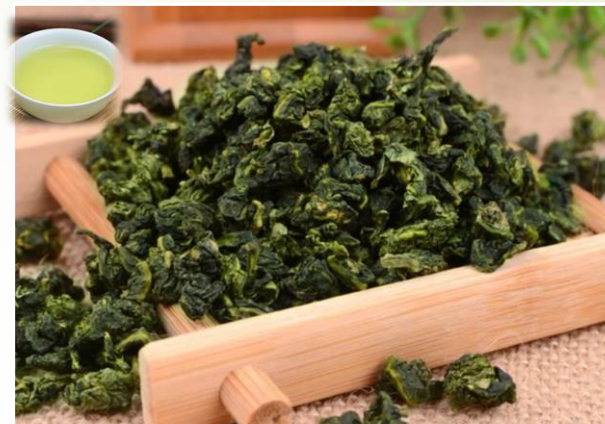
Bouddha de fer 15 €t/c/50g

Notes de noisettes torréfiées et caramélisées.