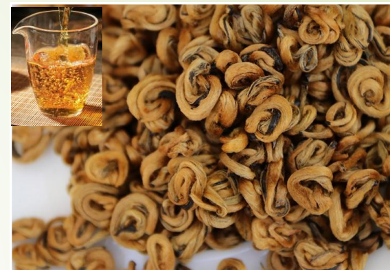
Thé rouge – Pépité d'or 18 €t/c/50g