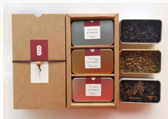
Assortiments de 3 thés 34.90 €t/c