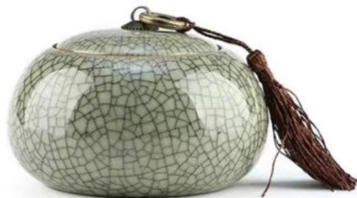
P3 Kaki craquelé