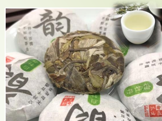
Blanc FUDING – Royal 15 €t/c/50g Notes florales et vanillées