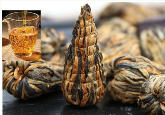
Thé rouge – Pagode royal 15 €t/c/50g