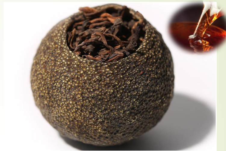
Pu'er - Citrus 15 €t/c/50g