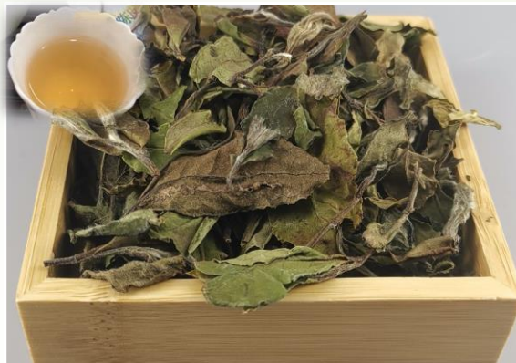
Thé blanc – Prunus 12 €t/c/50g Note fruitée de prune