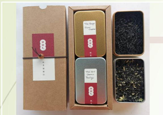
Assortiments de 2 thés 25.90 €t/c