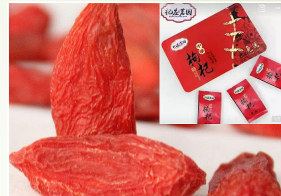
Goji en coffret 250g 39 €Ttc