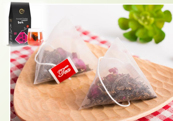
Thé noir à la rose 9.90 €ttc/boîte