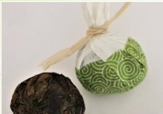
Oeil de dragon 10 €t/c/50g Note de prune et d'écorce d'orange