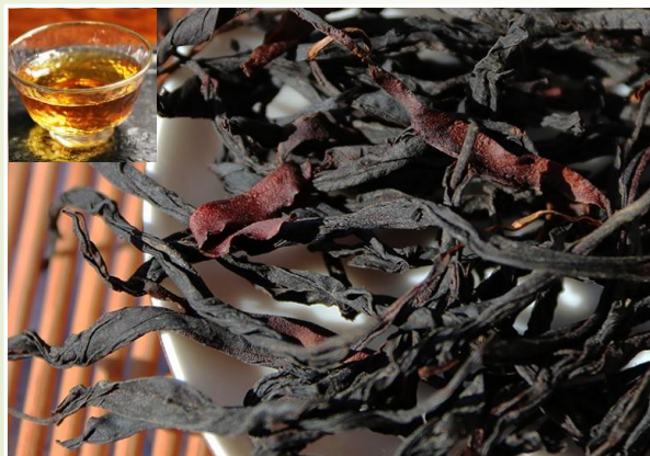
Thé rouge – Antique Sauvage 20 €t/c/50g

Naturellement fruité et légèrement sucré