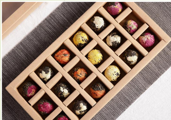
Thé fleurs-assortiments 29.90 €Ttc