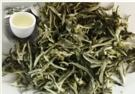
Bai mu dan – Pivoine blanche Notes florales et vanillées 25 €t/c/50g