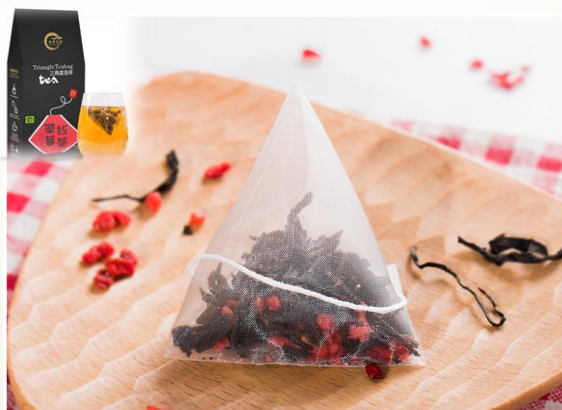
Thé rouge à la fraise 9.90 €ttc/boîte