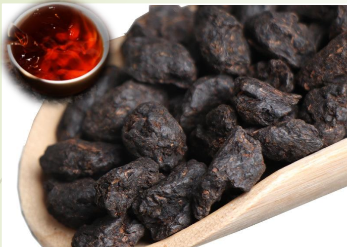
Pu'er - Perle noire 10 €t/c/50g