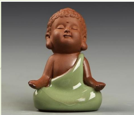
Bouddha Q1 : 19.90 €Ttc