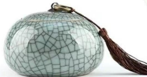
P2 Gris craquelé