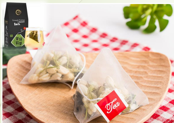
Thé vert Jasmin 9.90 €ttc/boîte